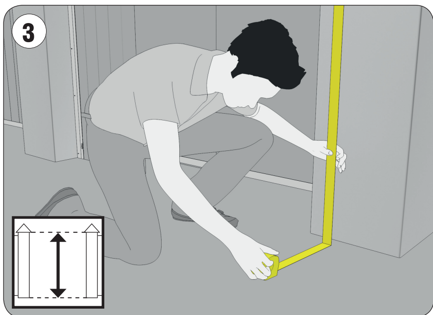
Фото результата замера высоты проема (Н).